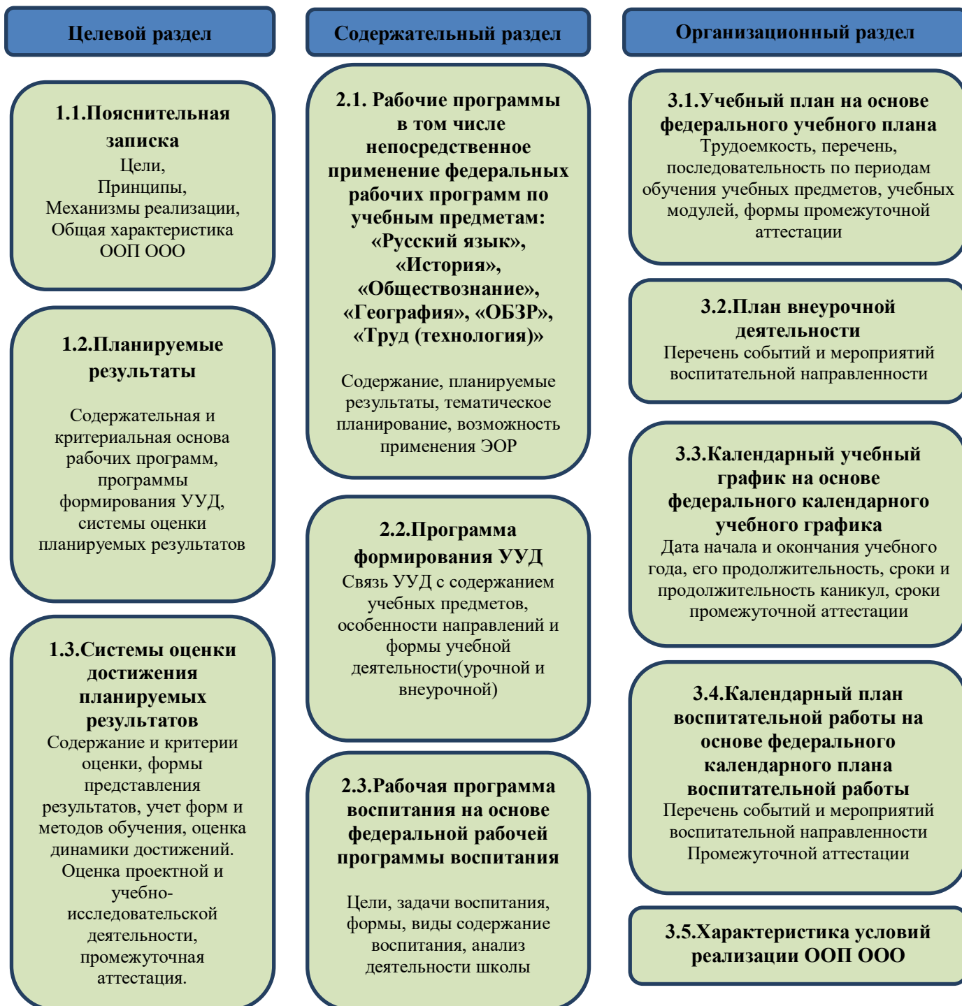
Схема 2. Структура ООП ООО

При осуществлении образовательной деятельности МОАУ «ООШ № 2» осуществляется взаимодействие с организациями-партнерами, в числе которых средние профессиональные учебные заведения «ГАПОУ НСТ», «ГАПОУ НПК» и промышленные предприятия ООО «Аккерманн Цемент», АО «Уральская Сталь».